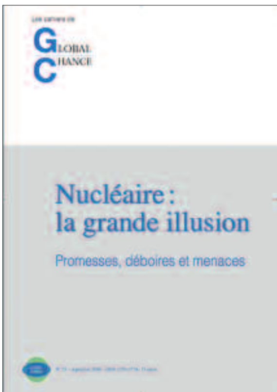
Publication n° 25 de Global Chance de septembre 2008

cause de vieillissement. Les autorités procèdent en réalité à l'inverse, en accordant, selon des modalités qui varient d'un pays à l'autre, des extensions d'exploitation.